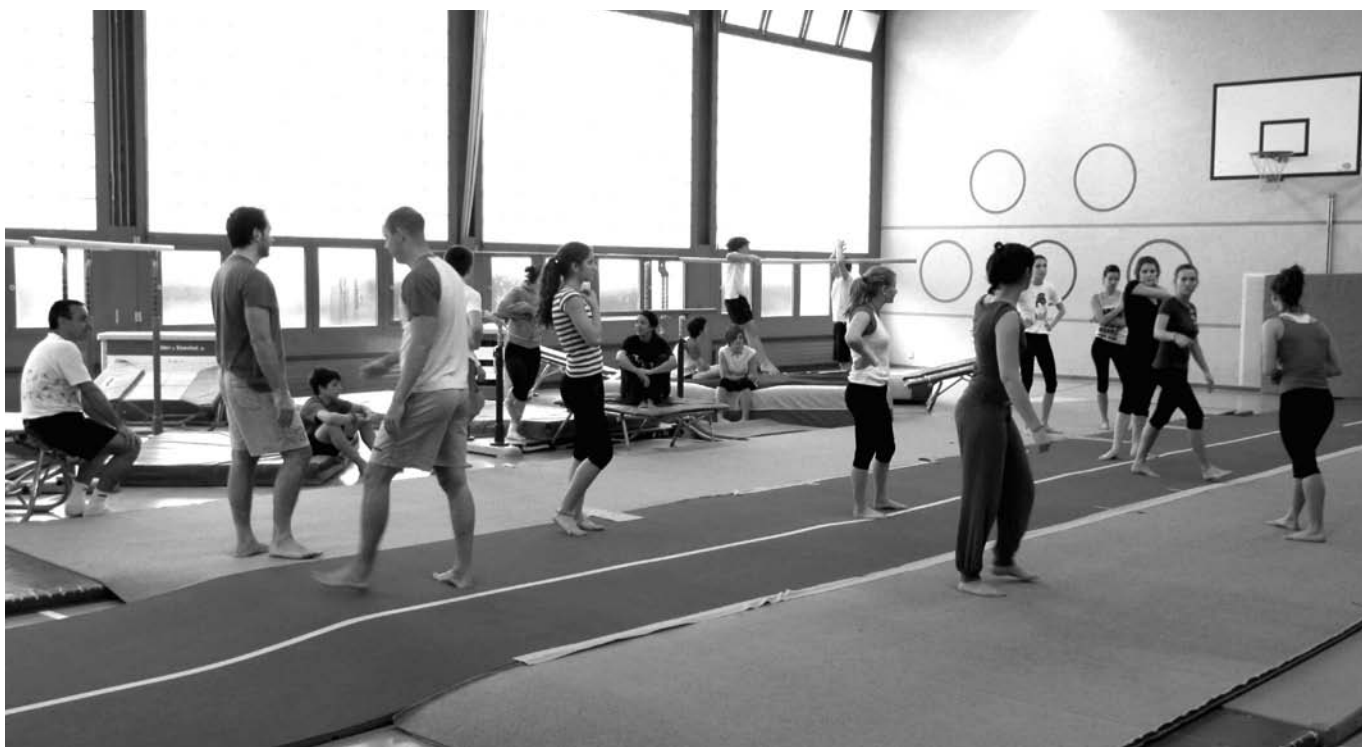
...gli attivi e le attive si preparano per una trasferta a Riccione