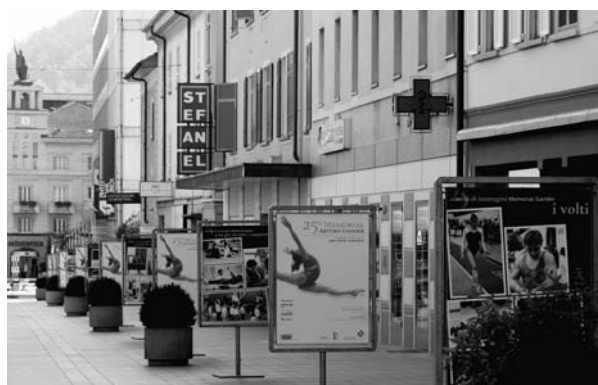
Foto accattivanti proposte in maniera molto efficace hanno dunque abbellito uno scorcio di Corso San Gottardo a sottolineare l'entusiasmo e la passione con cui la SFG Chiasso ricorda e ricorderà anche in futuro il suo grande Maestro scomparso.

Magari esageriamo con i superlativi ma pensiamo che diversamente non si può tornare su questa iniziativa che per quasi un mese ha posto sotto gli occhi di tutti uno spaccato di storia chiassese di cui la popolazione locale deve essere orgogliosa.