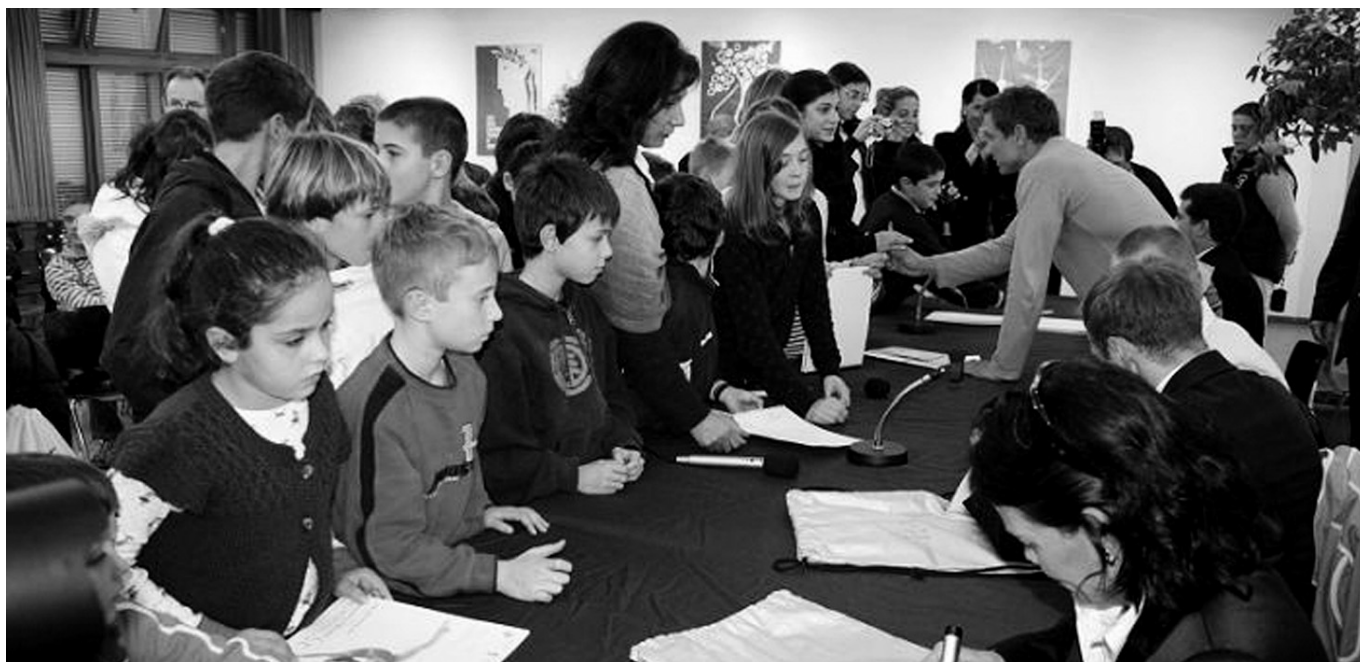
I campioni presi d'assalto da piccoli fans!

Chiasso con un sentimento di affetto e gratitudine e noi ne siamo molto fieri!