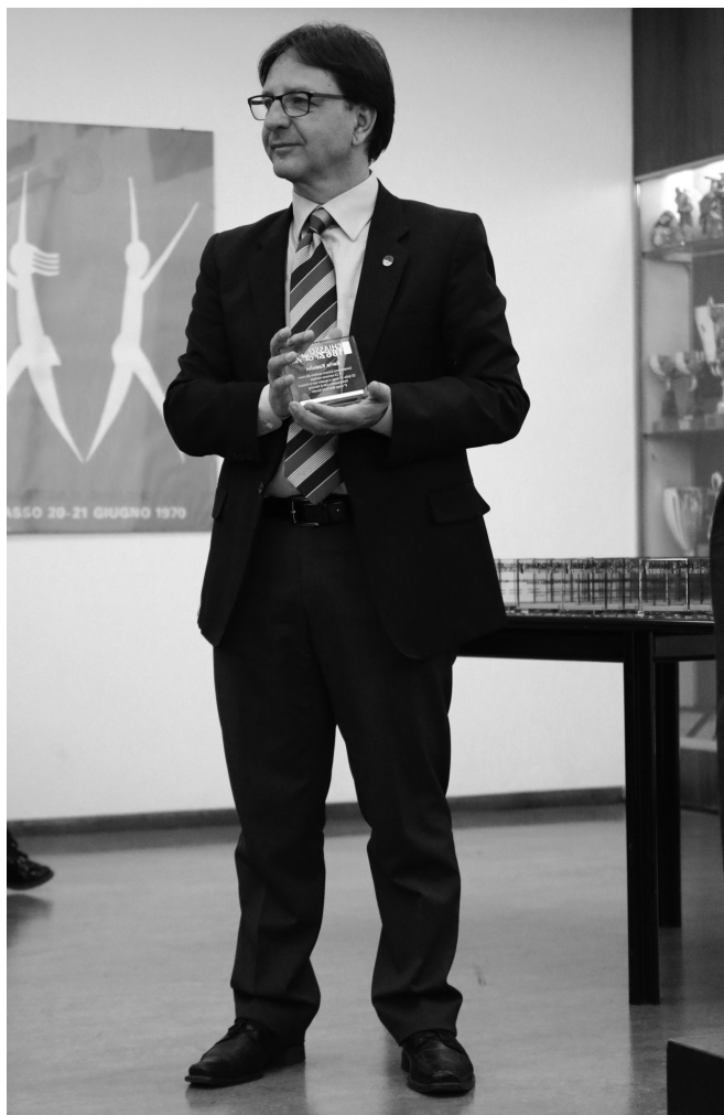
Il Presidente Walter Cremasch

Lascio ora la parola ai miei colleghi di comitato, ringrazio tutti per la fiducia che speriamo ci vorrete ancora accordare, siamo sempre con le antenne alzate per ascoltare i punti di vista di tutti voi per poterci migliorare e vi auguro un buon proseguimento di serata.